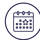
Organisateurs d'évènements en direct